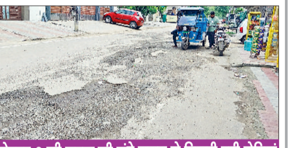
सेक्टर-3 की सड़क की लंबे समय से बिखरी पड़ी रोड़ियां

शहर की नई बनाई गई ज्यादातर सड़कें 4 से 6 महीने के अंतराल में ही टूट कर बिखर रही हैं, जिसका मुख्य कारण गुणवत्ता की कमी है। नगर परिषद की ओर से नई बन रही सड़कों की मांजिटिंग तक नहीं की जा रही है। टेंडर देने के बाद सड़क निर्माण कार्य ठेकेदार के भरोसे ही छोड़ा हुआ है। सड़क बिखरने के बाद ठेकेदार की ओर से पैचवर्क करके खामियों को ढका जा रहा है। नगर परिषद की ओर से सेक्टर-3, सेक्टर-4 व सचिवालय के सामने तारकोल की सड़क बनाई गई सड़क एक साल में ही टूटकर बिखर चुकी है। इन सड़कों पर कई बार पैचवर्क भी किया जा चुका है, लेकिन अब प्रशासन की ओर से सिर्फ सड़कों की मरम्मत करने के आदेश दिए जा रहे हैं, जिन पर विभागों की ओर अमल नहीं किया जा रहा है। सरकुलर रोड सहित कई सड़कों पर गड़बड़ा नजर आ रहे हैं। बाय मार्केट की नई सड़क में भी रिमोट गायब होने लगी है।