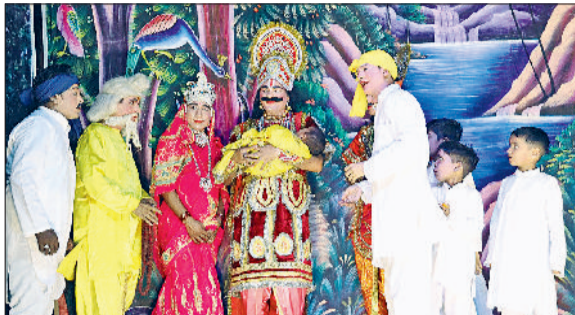
रेवाड़ी। रेलवे कॉलोनी की रामलीला में माता-पिता को पालकी पर ले जाता श्रवण कुमार, रेलवे कॉलोनी की रामलीला में गुरु विश्वामित्र के साथ राम व लक्ष्मण तथा घंटेधर मंदिर की रामलीला में माता सीता जन्म का मंचन करते कलाकार।