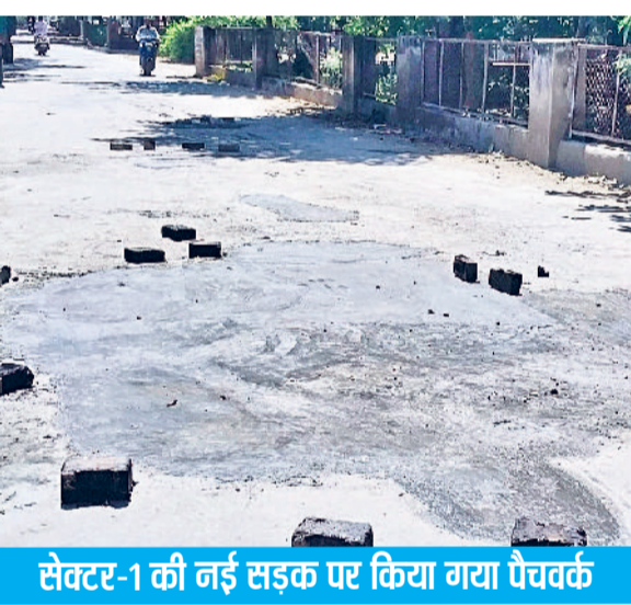
सेक्टर-1 की नई सड़क पर किया गया पैचवर्क

नगर परिषद की ओर से नई बन रही सड़कों की मांजिटिंग तक नहीं की जा रही नगर परिषद की ओर से सेक्टर-3, सेक्टर-4 व सचिवालय के सामने तारकोल की सड़क बनाई गई सड़क एक साल में ही टूटकर बिखर चुकी