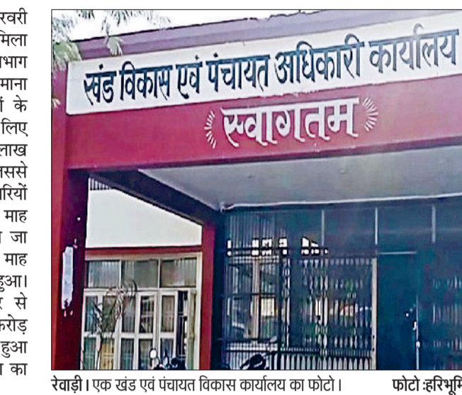
रेवाड़ी। एक खंड एवं पंचायत विकास कार्यालय का फोटो।