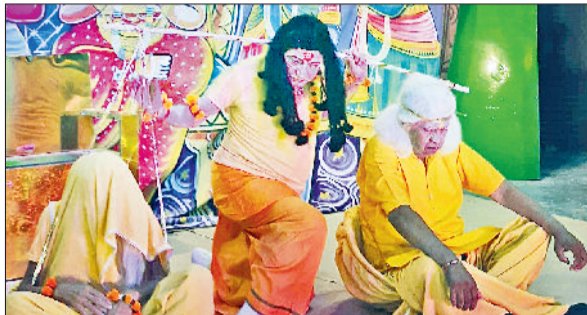
रेवाड़ी। रेलवे कॉलोनी की रामलीला में माता-पिता को पालकी पर ले जाता श्रवण कुमार, रेलवे कॉलोनी की रामलीला में गुरु विश्वामित्र के साथ राम व लक्ष्मण तथा घंटेधर मंदिर की रामलीला में माता सीता जन्म का मंचन करते कलाकार।