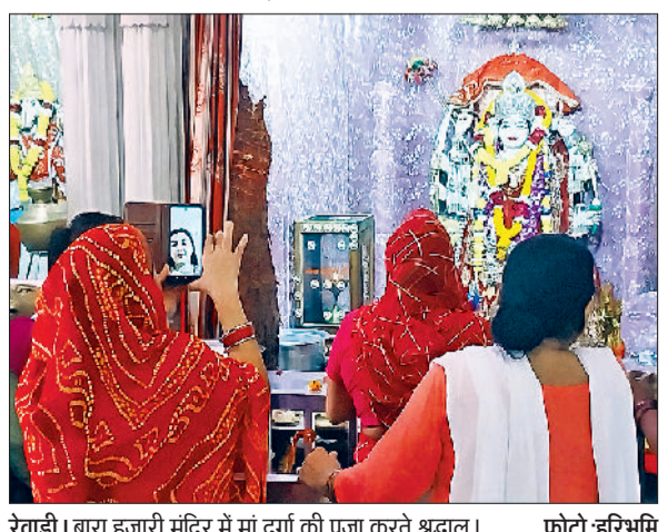
रेवाड़ी। बारा हजारी मंदिर में मां दुर्गा की पूजा करते श्रद्धालु।

मां दुर्गा के चौथे स्वरूप को कुष्मांडा देवी के नाम से जाना जाता है। वीरवार को चौथे नवरात्र पर उपासक मां कुष्मांडा की उपासना करेंगे। धार्मिक ग्रंथों में उल्लेख है कि जब सृष्टि का अस्तित्व नहीं था, चारों ओर अंधकार ही अंधकार था तब मां कुष्मांडा ने अपने हस्त से ब्रह्माण्ड की रचना की थी, कुष्मांडा मां ही सृष्टि की आदि स्वरूपा आदि शक्ति हैं, इनके पूर्व प्रमाण का अस्तित्व था ही नहीं, मां का निवास सूर्यमण्डल के भीतर की देवीधामान और भास्वर है। मां के तेज प्रकाश से दसों दिशाएं प्रकाशित होती हैं, मां की 8 भुजाएं हैं, इनकी अष्टभुजा देवी के नाम से भी जाना जाता है। इनके 7 हाथों में कमण्डलु, धनुष-बाण, कमल पुष्प, अमृत कुण्ड कलश, चक्र तथा गदा है, 8वें हाथ में सभी सिद्धियों और निधियों को देने वाली जप माला है। मां का वाहन सिंह है। मां की उपासना करने से श्रद्धालुओं के समस्त रोग, शोक भी नष्ट हो जाते हैं, इनकी भक्ति से आयु, यश, बल और आरोग्य की वृद्धि होती है। मां भक्तों की उत्पत्ति से ही प्रसन्न हो जाती है। मां की उपासना मनुष्य को सहज भाव से भवभोग्य से पार उतारने के लिए सर्वाधिक सुगम और श्रेष्ठतम मार्ग है।