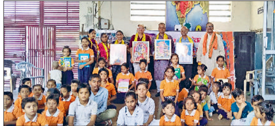
रेवाड़ी। कार्यक्रम में शिक्षकों को चित्र भेंट करते आयोजक।