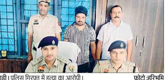
रेवाड़ी। पुलिस गिरफ्त में हत्या का आरोपी।